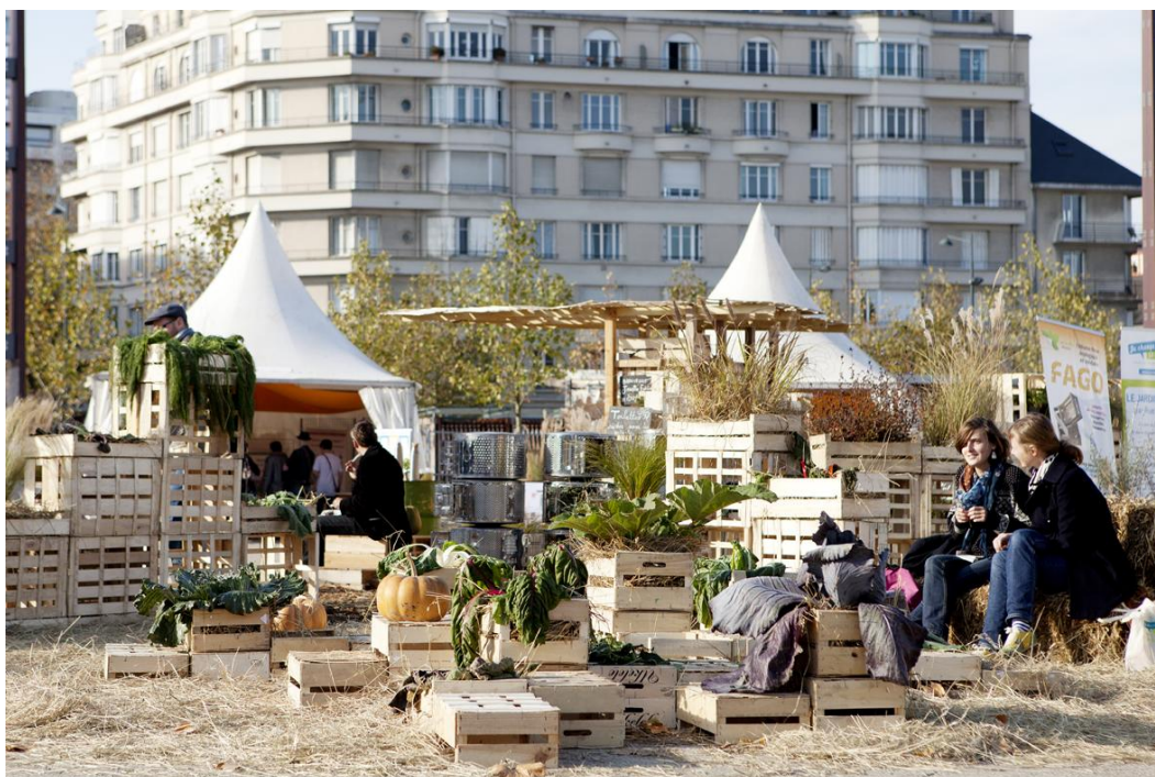
L'édition 2011 de la SERD à Rennes

Un film de la journée sera réalisé par la société Bilboquet afin de compléter la série de films déjà en ligne sur le site www.ca-change-tout.fr , volet Prévention des déchets.